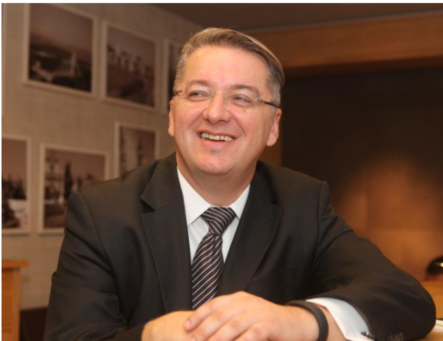
„General Manager” u Ljudskim Potencijalima

Koja je sličnost između ove dvije simpatične životinje ?