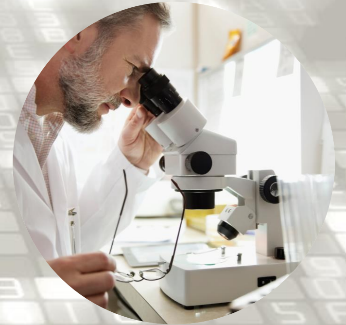
ISTRAŽIVANJE I RAZVOJ