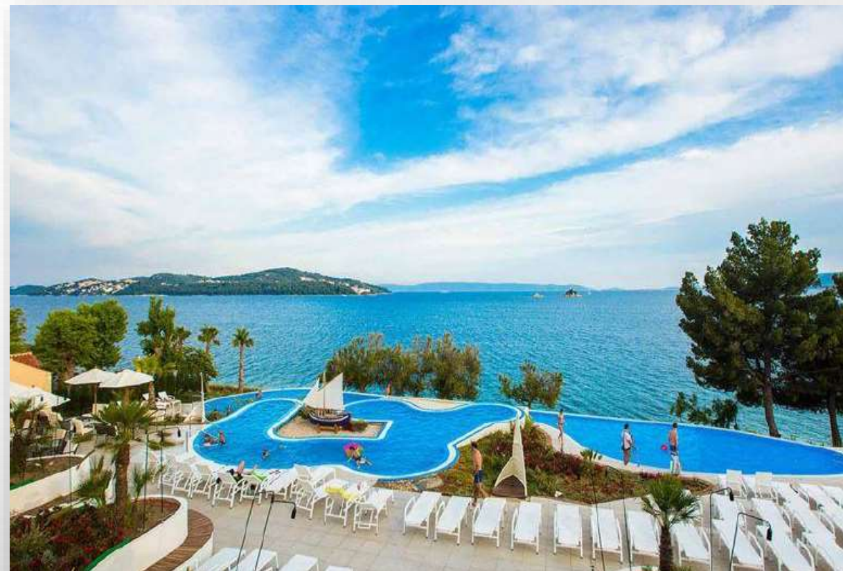
Kamp Vranjica Belvedere, Trogir