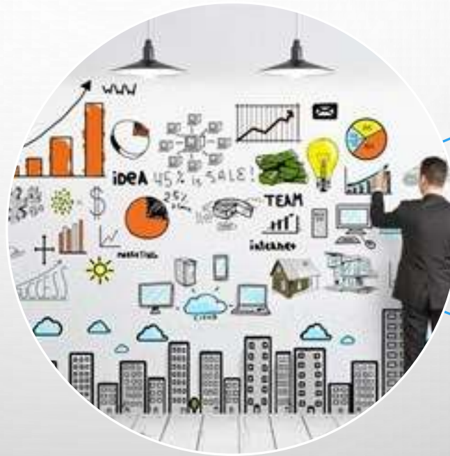
Upravljanje državnom imovinom

Ministarstvo prostornoga uređenja, graditeljstva i državne imovine