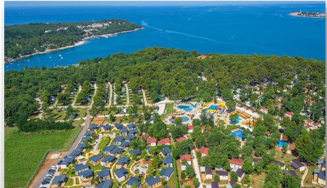
Kamp Lanterna, Novigrad

Iznos jedinične cijene zakupnine umanjuje se dodatno: