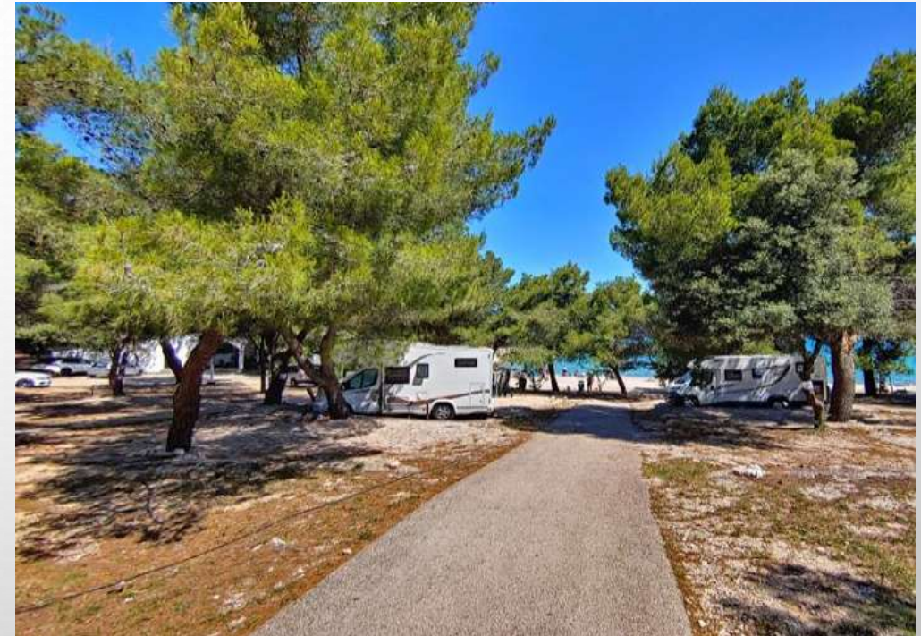
Kamp Jazina, Tisno