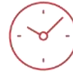
Radno vrijeme poslovnica